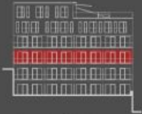
situace bytové jednotky dvorní pohled