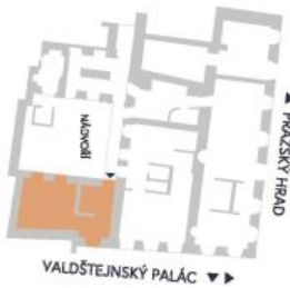
UMÍSTĚNÍ V RÁMCI PATRA