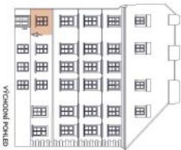
UMÍSTĚNÍ V RÁMCI PODLAŽÍ