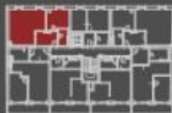
poloha bytové jednotky celkový půdorys