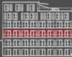
poloha bytové jednotky dvorní pohled

UPOZORNĚNÍ: Tento list není prohlášením o kvalitě nábídky a nedělá u žádné záruky, celkové informace o nemovitosti lze vyhledat. Plochy jednotlivých místností jsou pouze orientační. Vybavení vybavení a plánováání (kuchy, lázně, nábytek) není součástí nabídky. Pro více detailů je specifikováno ve standardu. UPOZORNĚNÍ: výkaz výměr: podlahová plocha bytu v jednotce: 41,72 m 2 , podlahová plocha bytu ve vnitřní hálce (kódy E-1): 36,203 m 2 , podlahová plocha bytu v jednotce ve vnitřní hálce (kódy E-1): 36,203 m 2 , celková podlahová plocha bytu v jednotce (kódy E-1): 77,926 m 2 . úžitná plocha bytu: 58,4 m 2 , úžitná plocha bytu v jednotce (kódy E-1): 58,4 m 2 , celková úžitná plocha bytu v jednotce (kódy E-1): 116,8 m 2 . podlahová plocha bytu v jednotce (kódy E-1): 41,72 m 2 , úžitná plocha bytu v jednotce (kódy E-1): 58,4 m 2 , celková úžitná plocha bytu v jednotce (kódy E-1): 100,12 m 2 . úžitná plocha bytu v jednotce (kódy E-1): 58,4 m 2 , celková úžitná plocha bytu v jednotce (kódy E-1): 116,8 m 2 . úžitná plocha bytu v jednotce (kódy E-1): 58,4 m 2 , celková úžitná plocha bytu v jednotce (kódy E-1): 116,8 m 2 . úžitná plocha bytu v jednotce (kódy E-1): 58,4 m 2 , celková úžitná plocha bytu v jednotce (kódy E-1): 116,8 m 2 .