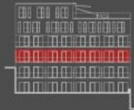
situace bytové jednotky dvorní pohled