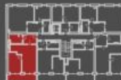
situace bytové jednotky celkový pohled