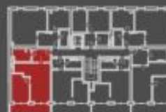
situace bytové jednotky celkový pohled