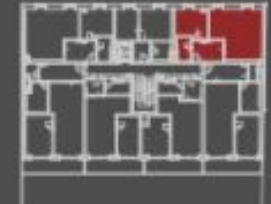
situace bytové jednotky celkový půdorys