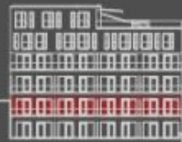
situace bytové jednotky dvorní pohled