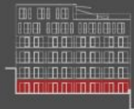
situace bytové jednotky dvorní pohled

upozornění: Tento list není podrobný stavovací výkres a možná určitých odchylek od skutečného provedení je vyhrazeno. Plochy jednotlivých místností jsou pouze orientační. Vytvářena je pouze v příloze bytu (kuch. linka, koupelna) není součástí obkladů. Rozsah služeb je specifikován ve smlouvě. základní výměry podlahové plochy bytu v jednotce: Dle zákona č. 84/2013 Sb., podlahová plocha bytu ve směru nahlášení vady č.: 366/2013 Sb. - podlahovou plochu bytu v jednotce tvoří podlahová plocha všech místností bytu včetně podlahové plochy všech ostatních místností i herního stolu. Uvedl bytu, jako jsou úhledy, skřepi, páře, kování a skřepované střešní konstrukce. Podlahová plocha je vymezena vnitřním okrajem stěnových konstrukcí včetně stěnových částí včetně jejich přechodových částí. Doporučujeme se touto podlahovou plochu ověřit měřicími přístroji, jako jsou například měřiče ve stěnách a kůře, nebo se při měření vyhnout měřičům ve střední části bytu.