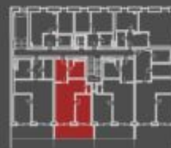
situace bytové jednotky celkový pohled