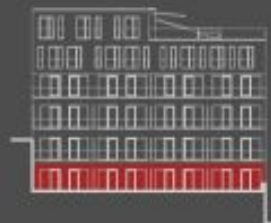
situace bytové jednotky dvorní pohled

upozornění: Tento list není podrobným stavacím výkresem a rozhodl učebních odůvodlen od skutečného provedení je vyřezáno. Plochy jednotlivých místností jsou pouze orientační. Vytvářené pořadí v příloze bytů (žensk. žlito, nábytek) není součástí smlouvy. Rozsah služeb je specifikován ve smlouvě. základní výpočet podlahové plochy bytu v jednotce: Dle zákona č. 84/2013, podlahová plocha bytu ve směru nahlášení vady č.: 366/2013 st. - podlahovou plochu bytu v jednotce tvoří podlahová plocha všech místností bytu včetně podlahové plochy všech ostatních místností i herních konzolů umístěných v bytu, jako jsou úložný skříň, police, stěny a stěnové systémy komunikace. Podlahová plocha je vymezena odlišným způsobem kromě místností s dřevěnými podlahovými deskami. Doporučujeme se touto podlahovou plochu ověřit odbornými prostředky, jako jsou například ultrazvukové měřiče a laser, nebo si při měření vyžádat ve smlouvě bytu.