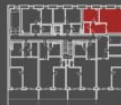
situace bytové jednotky celkový půdorys