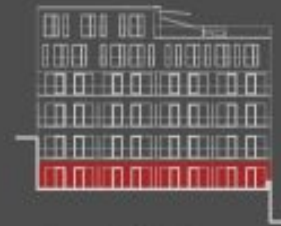
situace bytové jednotky dvorní pohled