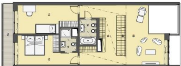
2. PATRO HORNÍ PODLAŽÍ