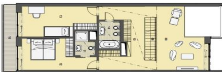
2. PATRO HORNÍ PODLAŽÍ