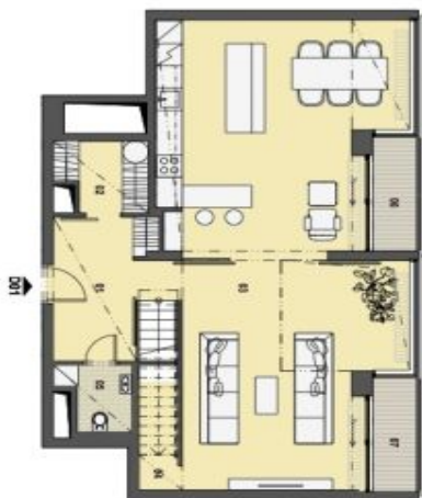
1. PATRO VSTUPNÍ PODLAŽÍ

Srdce našeho světa, výška místností 2,6m, vstup 2,8m v anýřích. Náklady na projekt výměry jsou orientací a deklarovány v výšce celkové ceny. Zpracování výkresů a výkresů, vedení a návrh, autorizované listiny včetně sporné části nejsou součástí dodávky bytu. Toto vyznění je zobrazeno pouze pro informaci.