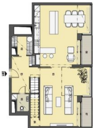
1. PATRO VSTUPNÍ PODLAŽÍ

Síťová sídelní výhled místnosti 2 km, resp. 2,6 km v okolí. Některé popis a plošné vymezení jsou orientační a nepřesné a vyznačují se vzhledem k přehledu a vzhledu k dispozici. Zobrazení vzhledem k dispozici, veškeré skládky, kuchyňské linky, včetně spotřebičů nejsou součástí dodávky bytu, toto vyznačení je zobrazeno pouze pro informaci.