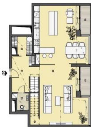
3. PATRO VSTUPNÍ PODLAŽÍ

Složení a měřítko výhledu: 2 km, resp. 2,6 km v okolí. Název popis a plošné vymezení jsou orientační a nepřesné a nepředstavují záruku. Zobrazení vzhledu interiéru, vnitřní stěny, kuchyňské linky, včetně spotřebičů nejsou součástí dodávky bytu. Toto vymezení je zobrazováno pouze pro informaci.