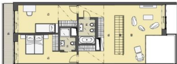
4. PATRO HORNÍ PODLAŽÍ