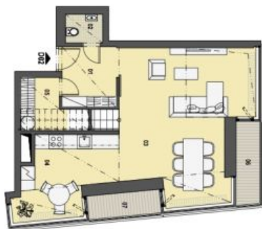
1. PATRO VSTUPNÍ PODLAŽÍ

Síťová architektura výhledem architektury. Zájem: cca 2,8 m v arších. Návrh: popis a plánové vymezení jsou orientační a nezávazné a nepředstavují záruku. Zobrazení vzhledu (obrázky, vektorové síťové, kuchyňské linky, včetně spotřebičů) nejsou součástí dodávky bytu, toto vyznění je zobrazeno pouze pro informaci.