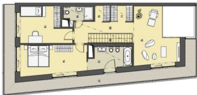
2. PATRO HORNÍ PODLAŽÍ