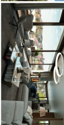
Na Pevně 2, 11000 Praha 1, Česká republika, +420 257 328 281, +420 257 322 032, info@svoboda-williams.com