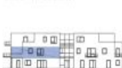
UMÍSTĚNÍ V RÁMCI PODLAŽÍ