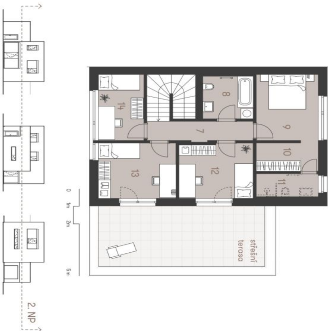
Schéma půdorysu domu představuje dispozici řešené domu, který může mítla a rozložit se i součástí dodané domu, zatímco je zabudováno pouze pro rezidenční. Specifikace pro konstrukci, povrchové úpravy a různé vybavení je předním přílohu "Standardi nemovitosti". Developer si vyhrazuje právo na změny a upřesnění bez předchozího upozornění.