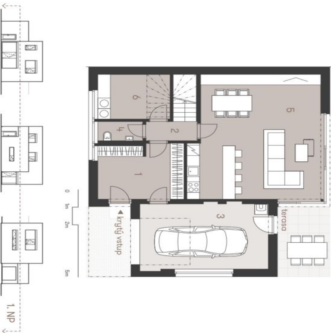
Schéma půdorysu domu představuje dispozici včetně domu. Každý údaj byla a nikdy jak nejsou určité hodnoty domu, nežli je zobrazeno pouze pro odhadnout. Specifikace pro konstruktura, pořízení úpravy a rozstřel výstavby je předním grafický "Standard rekonstrukce". Developeri si vyhrazují právo na změny a upřesnění barev předchozího zpracování.