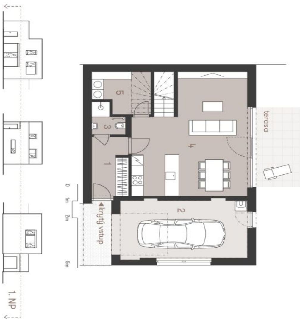
Schéma podrobněji ukazuje dispozicií federací domu. Kuchynská linka a obývací nábytek označují dodávkou domu, zřízení je zahrnuto pouze pro názornost. Specifikace pro kmenovce, povrchové úpravy a rozložení výhledů je předním přílohou "Standardní memořand". Developer si vyhrazuje právo na změny a upřesnění bez předání každé upozornění.