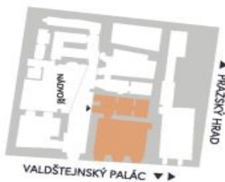
UMÍSTĚNÍ V RÁMCI PATRA