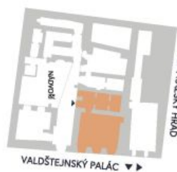
UMÍSTĚNÍ V RÁMCI PODLAŽÍ