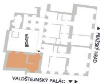
UMÍSTĚNÍ V RÁMCI PATRA